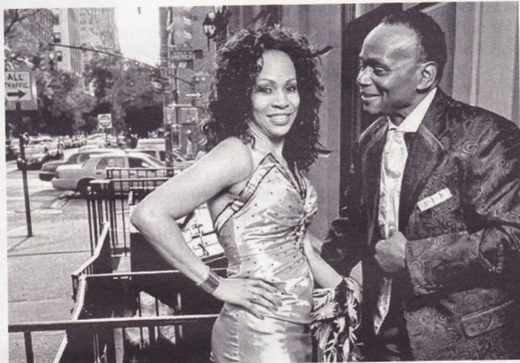
„Skake Your Groove Thing“: Peaches & Herb, am 24. Juni live in Kärnten