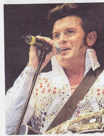
Einer der weltweit besten Elvis-Interpreten: Rusty summerandsoul